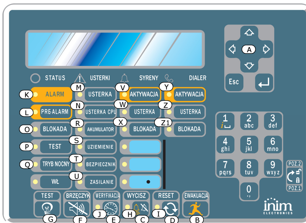
Rysunek 2 – Terminal wyniesiony, płyta czołowa

Terminal wyniesiony SmartLetUSee/LCD jest obsługiwany przez wszystkie modele central ppoż Smart. Natomiast terminal SmartLetUSeeLCD-Lite współpracuje wyłącznie ze SmartLine i SmartLight. W obydwu przypadkach nie wszystkie przyciski panelu będą działać przy współpracy z centralą SmartLine - aktywne będą następujące przyciski: