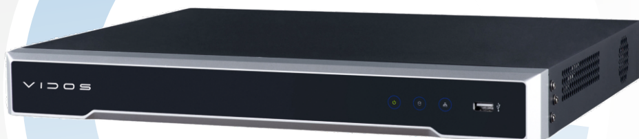
NVR-H2082-P Rejestrator sieciowy 8-kanałowy